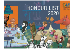
▲[IBBY Honour List 2020] (IBBY発行)

IBBYが2020年に60の国と地域から選んだ48言語、約200冊の世界の子どもの本を解説とともに展示します。