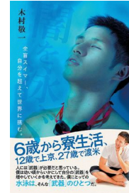
『闇を泳ぐ』 木村敬一著 ミライカナイ

先天性疾患により2歳で視力を失う。小学校4年生で水泳を始め、単身上京した筑波大付属盲学校(現・筑波大学附属視覚特別支援学校)で水泳部に所属。パラリンピックには、2008年の北京大会から4大会連続出場する。2012年ロンドン大会で銀メダル1・銅メダル1を、16年リオ大会では銀メダル2・銅メダル2の日本人最多メダルを獲得。4度目の出場となる東京2020大会では、金メダル1・銀メダル1を獲得した。著書に、『闇を泳ぐ』(ミライカナイ)がある。