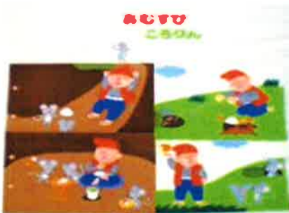
布の本「おむすびころりん」