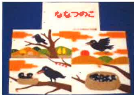
布の本「ななつのこ」