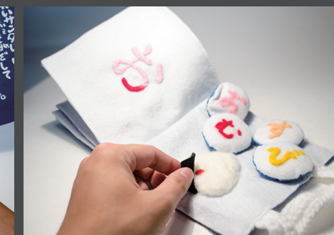
高校生部門・優秀賞