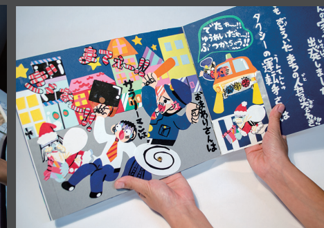
高校生部門・優秀賞