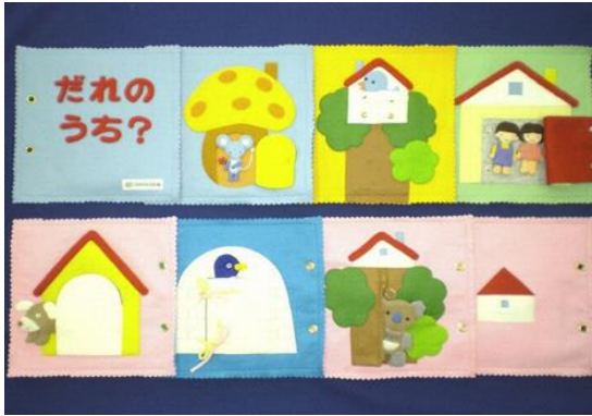
▲布絵本「だれのうち？」 【日本の布の本の元祖】 (公財)ふきのとう文庫(北海道)