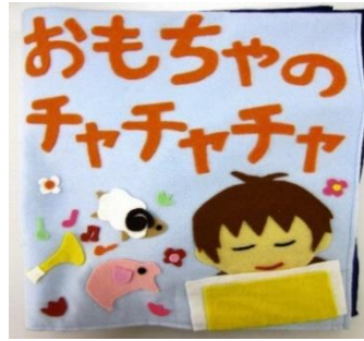
▼布絵本 「おもちゃのチャチャチャ」 静岡福祉大学学生制作